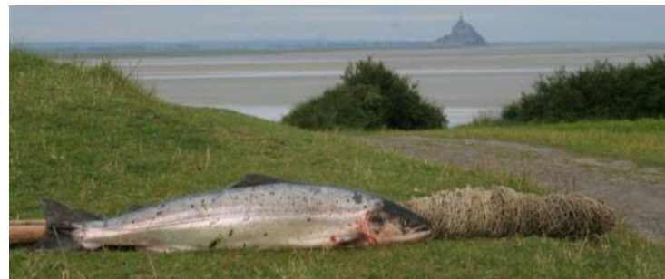
saisie d'un saumon braconné en baie du Mont St Michel