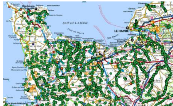
Référentiel des obstacles à l'écoulement